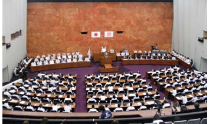
日本J.C.神奈川ブロック協議会主催の事業、公募で選出された県内各地高校生議員からの質問に知事から答弁が行われ、最終日に私が県議会を代表して挨拶をさせていただきました。