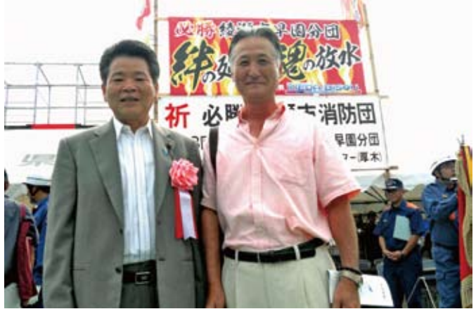
綾瀬市代表として私も所属していた早園分団が出場し、見事に最優秀賞を獲得しました。綾瀬市代表は8年ぶりの優勝でした。