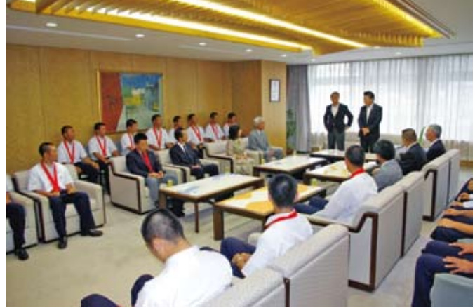
激戦の神奈川県予選を勝ち抜き、夏の甲子園出場を果たした桐光学園野球部の皆さんを激励させていただきました。